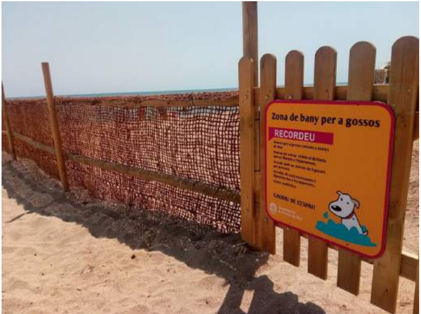
L'espai per a gossos a Arenys de Mar.