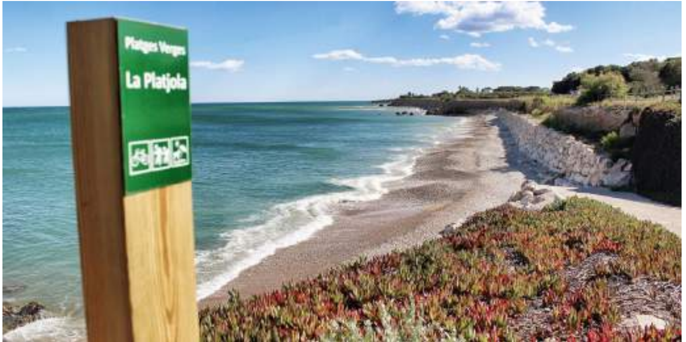
La platja d'Alcanar apta per a gossos.

Es troba a Deltebre ( http://www.deltebre.cat ), al Parc natural del Delta de l'Ebre. S'hi arriba anant amb cotxe des de Deltebre en direcció Riumar. Poc abans d'entrar al nucli, hi ha una rotonda on està senyalitzada la Bassa de l'Arena. És una platja verge, extensa i aïllada de sorra fina i aigües tranquil·les.