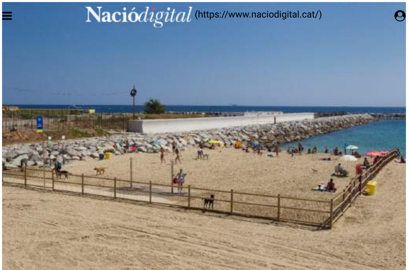
La platja de gossos de Barcelona.