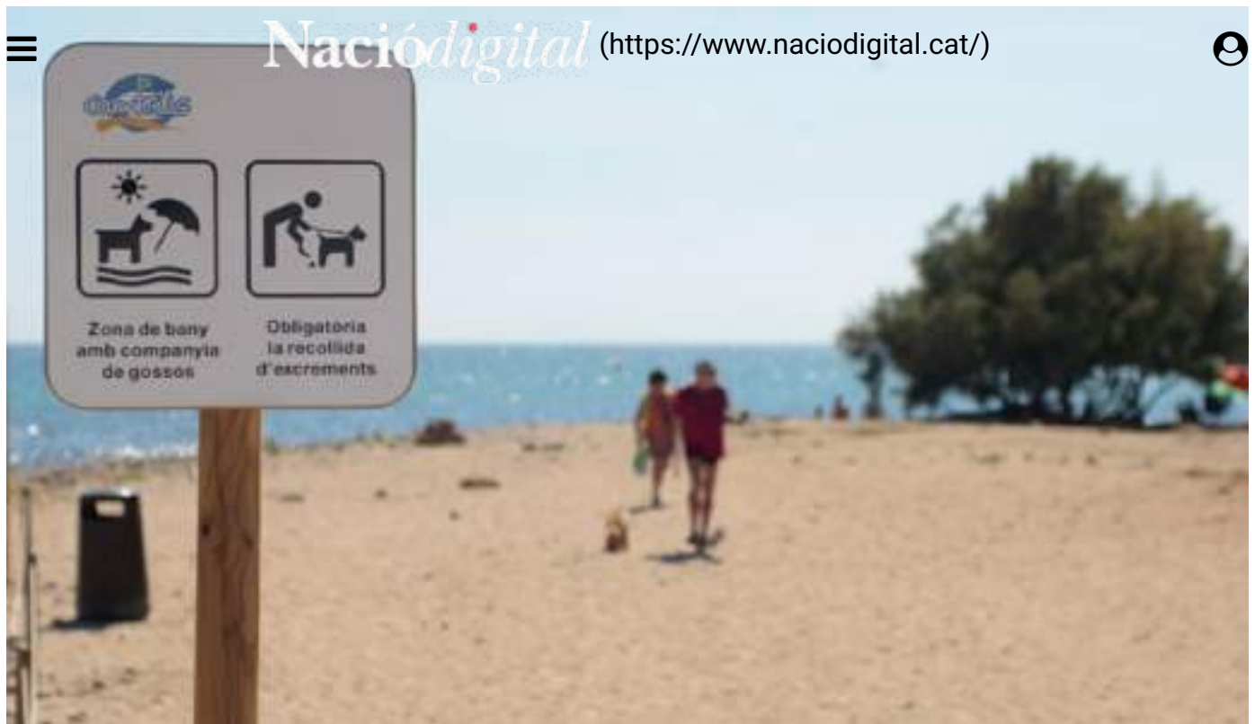
Platja de Cambrils per a gossos.