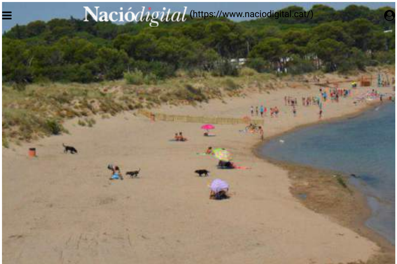
Platja del Rec del Molí de l'Escala.